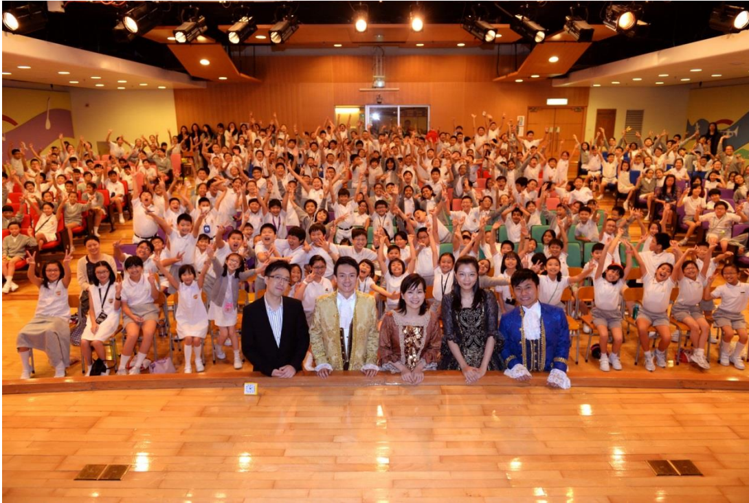
圖 4：為了培育新一代聲樂人才，嘉華國際贊助一年一度的「嘉華香港歌劇院夏令營」，為具有才華的兒童提供為期三周的歌劇訓練，內容包括聲樂、戲劇、表演、舞蹈和歌唱等。在排練音樂劇的過程中，讓參加者親身體驗歌劇的魅力，提升他們的自信心、創造力和表達能力之餘，亦有助擴闊他們對於表演藝術的眼界